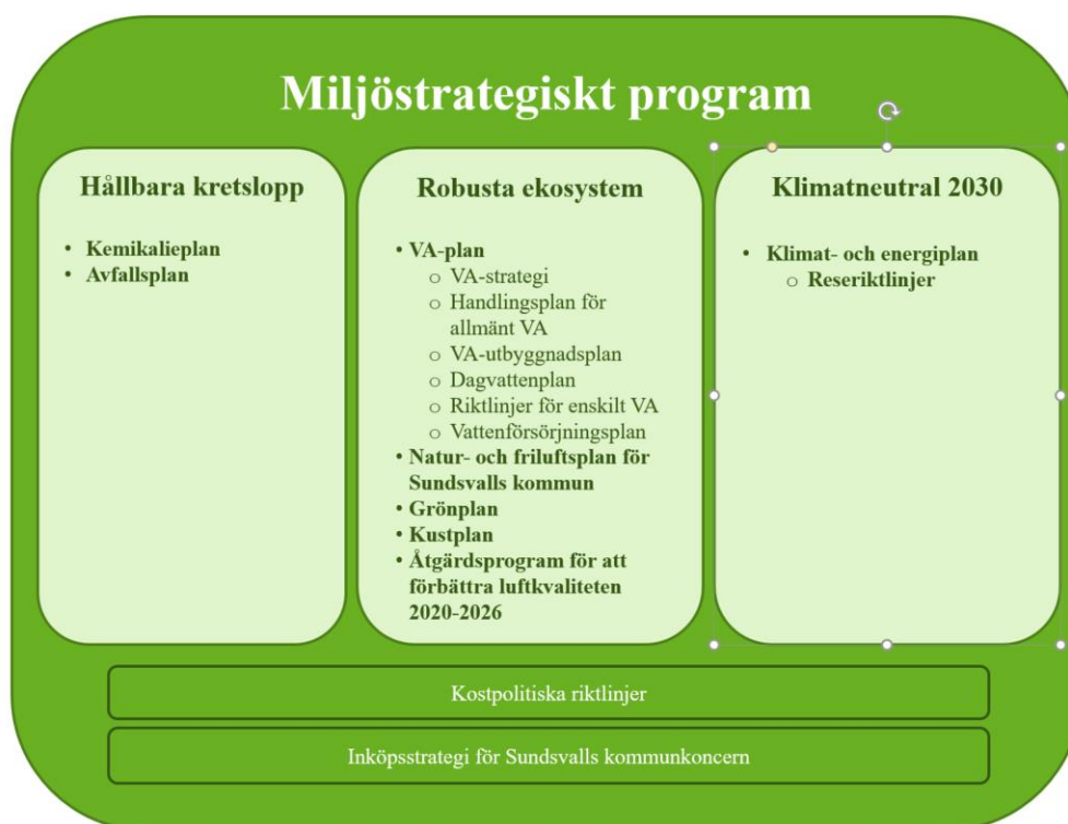
Figur 1: Illustration av hur det Miljöstrategiska programmet hänger ihop med andra styrdokument inom miljöområdet i Sundsvalls kommunkoncern.