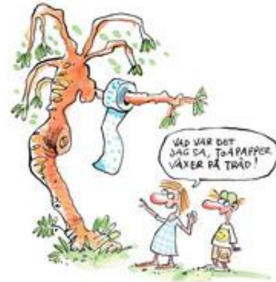
Illustration: Christer Lindberg