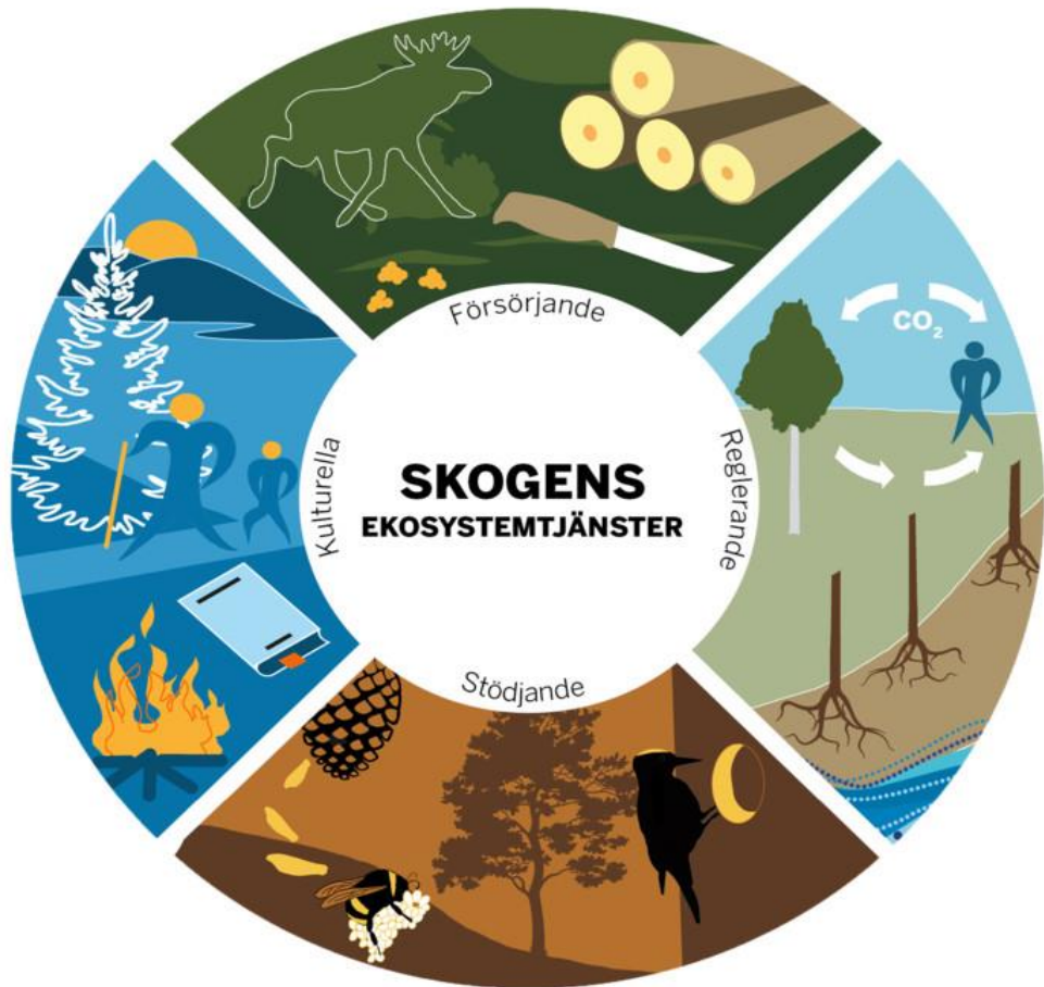
Illustration Bo Persson

För en god och säkerställd tillgång av biomassa behövs åtgärder för hållbar tillväxt i den svenska skogen.